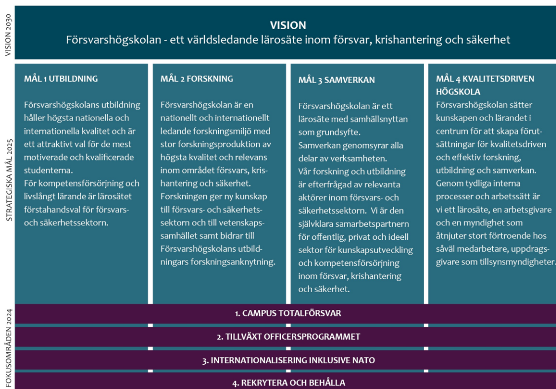
Figur 1: Försvvarshögskolan vision, strategiska mål och fokusområden 2024

Försvvarshögskolans ledning har med utgångspunkt i det rådande omvärldsläget och FHS Vision och strategi 1 identifierat fyra fokusområden för verksamhetsåret 2024. Fokusområdena ska operationaliseras via ett antal insatser i form av riktade uppdrag och projekt samt handlingsplaner.