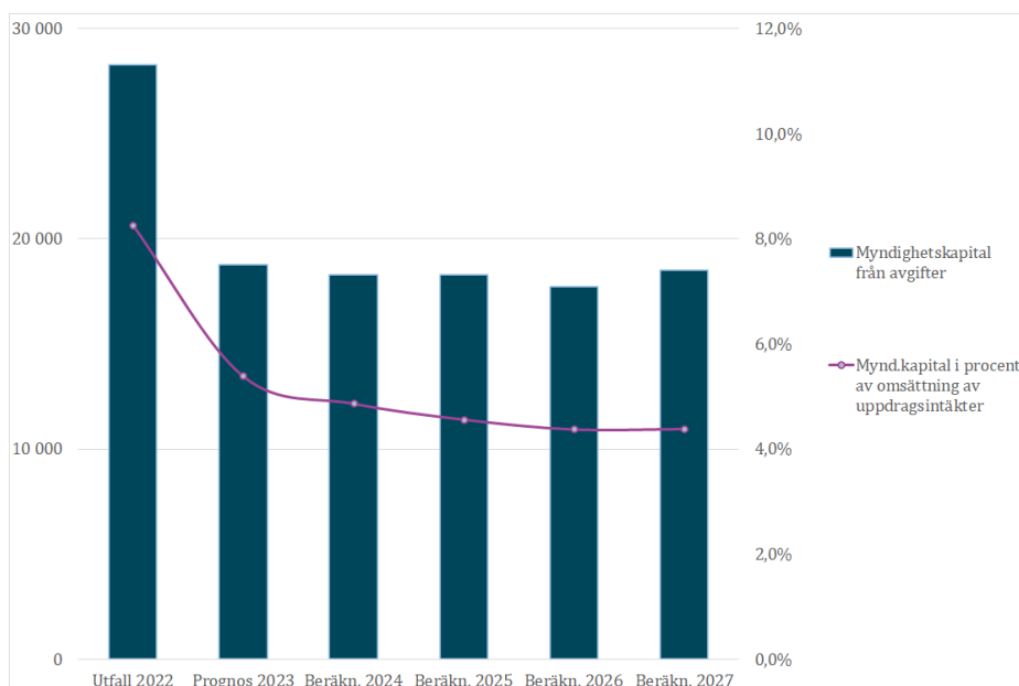
Diagram 2: Utveckling av myndighetskapital från avgifter.